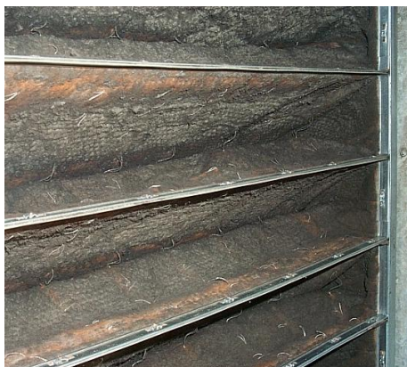
Filtros de bolsa sucios