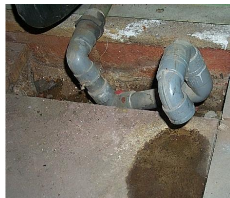
Desagüe no conducido